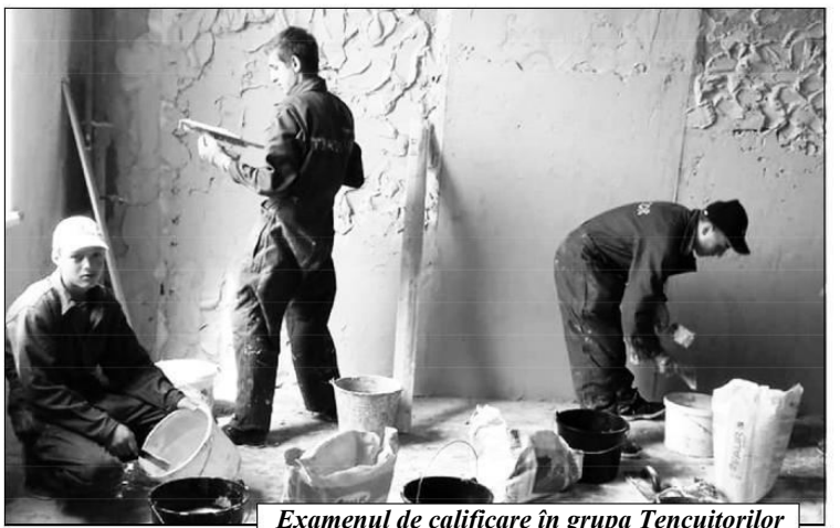
Examenul de calificare în grupa Tencuitorilor