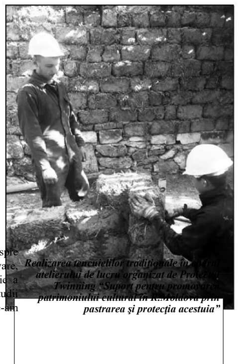
Realizarea tencuieților tradiționale în atelierul de lucru organizat de Proiect Twinning „Suport pentru promovarea patrimoniului cultural în R.Moldova prin pastrarea și protecția acestuia”